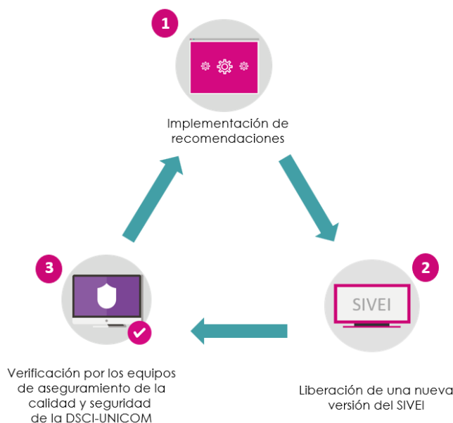
Diagrama 1. Atención de las recomendaciones de los auditores.